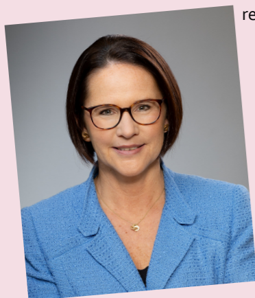
Yuriko Backes Ministre de l'Égalité des genres et de la Diversité

Chaque panneau indicateur est une porte ouverte sur une histoire — veillons à ce que la moitié des histoires de l'humanité ne restent pas inédites.